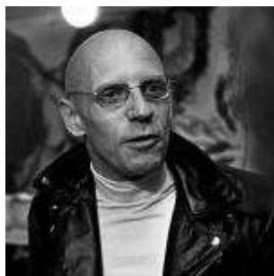
Michel de Foucault

Tiene obras como: Enfermedad mental y personalidad (1961), El orden del discurso, Arqueología del examen médico, Una arqueología de las ciencias humanas (1969), La arqueología del saber (1970), Historia de la sexualidad (1977), Las palabras y las cosas.